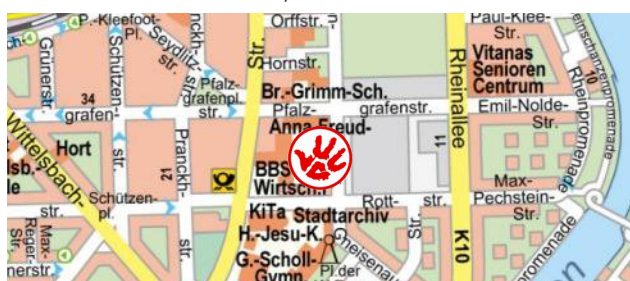
BBS SGH Anna-Freud-Schule / BBS Wirtschaft 1

Beratung zur Berufsorientierung, das Sozialkompetenztraining und die Zusammenarbeit mit der Agentur für Arbeit und der JBA plus.